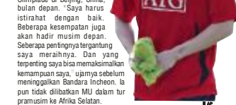
Park Ji-sung

SEOUL—Pemain sayap Manchester United Park Ji-sung mengharapkan tambahan waktu istirahat untuk memulihkan kondisinya. Gelandang asal Korea Selatan itu sudah tiba di Inggris, kemarin, untuk memulihkan cedera lalu menjelang Liga Primer Inggris. Akibat cederanya itu, Park absen memperkuat timnas Korsel melawan Turkmenistan dan Korea Utara dalam Kualifikasi Piala Dunia 2010. Bahkan, ia pun terpaksa dicoret dari timnas yang akan beraga pada Olimpiade di Beijing, China, bulan depan. "Saya harus istirahat," dengan baik. Beberapa kesempatan juga akan hadir musim depan. Seberapa pentingnya tergantung siapa merealhnya. Dan yang terpenting saya bisa memaksimalkan kemampuan saya," ujanya sebelum meninggalkan Bandara Incheon. Ia pun tidak dilibatkan MU dalam tur pramusim ke Afrika Selatan.