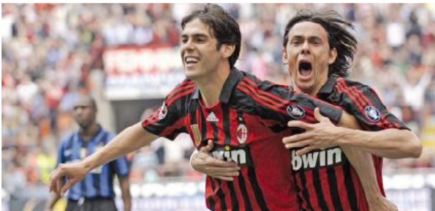
ASET BERHARGA: AC Milan sangat menyadari bintang asal Brasil, Kaka (dri), merupakan aset mereka paling berharga. Klub elite Seri A itu pun tidak ingin melepas pemain terbaik dunia itu meski mendapatkan tawaran sebesar Rp1,44 triliun dari tim Liga Primer Inggris Chelsea.