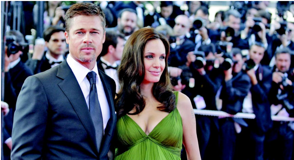
■ AP/ MATT SARLES